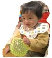
「どこコロコロしようかな？」