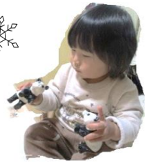
「パンダさん、こんにちは」