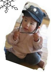
「部屋でもかぶってるの」