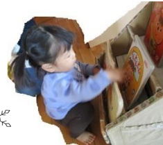
「どの絵本にしようかな」