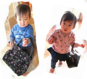
「バックを持ってお出掛け」