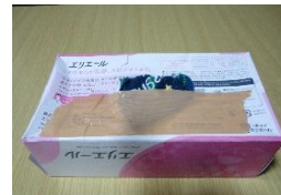
④外に出ている布部分をガムテやテープで貼って強度を出す。