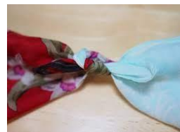
②ハンカチの端と端を結ぶ