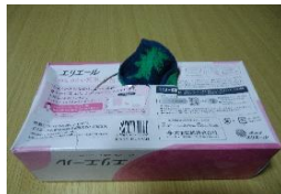
③ハンカチの一番端の布を箱の中に入れ、切り込みを入れた箱の底から外に出す