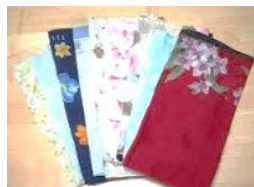
①ハンカチを準備する

「じょうしゃ ぶーぶーぶーぶー」 「みず じゃあじゃあじゃあ」、 楽しく明解な絵と リズムカルなことばが詰まっています☆