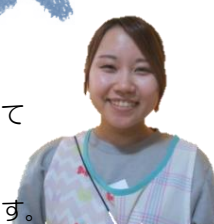
★★ らん 蘭

引き続き、子どもたち の成長を近くで見守る ことがとても嬉しく、 1年間が楽しみです。 笑顔で楽しく過ごして いきます。