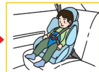
幼児用シート(15か月~4歳ごろ)