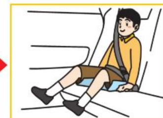
学童用シート(4歳ごろ~12歳ごろ)