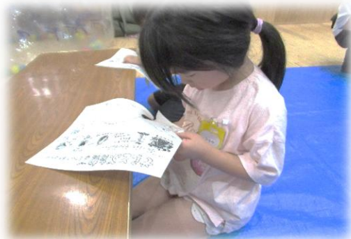
線の上を慎重に切って…