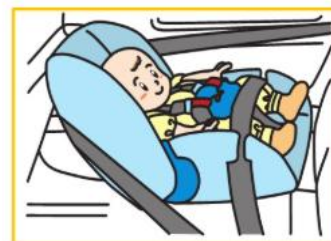
乳児用シート(新生児~1歳ごろ)