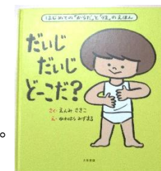
「だいたい だいたい どーこだ？」 作・遠見才希子 絵・川原瑞丸

絵本を通して、自然に理解できるよう関わっています。無理せず教え込むことはせず、子ども1人ひとりの理解や反応を大切にしながら安心できる言葉かけを心掛けて行きます。また、「心と体を守る歌」を使うのも良いかもしれませんね。（YouTubeで公開しています）