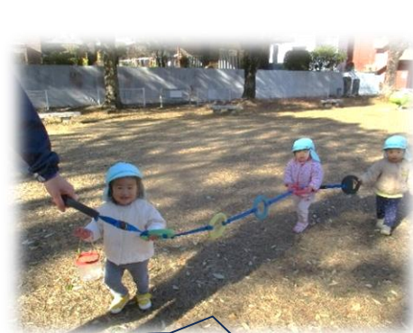
ひよこ組 誘導ロープを上手に持っているね！ 歩くのが楽しいね。