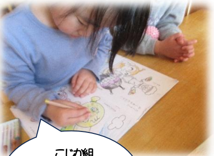
こじか組 鉛筆の正しい握り方を 意識しています。